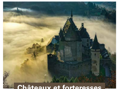
Châteaux et forteresses

Entre plaines et forêts, parsemés de lacs et de rivières, les paysages du Luxembourg charment autant qu'ils fascinent. Et la randonnée pédestre est certainement le meilleur moyen de les découvrir. Parcourir le Luxembourg à pied, c'est la promesse d'une surprise à chaque étape de votre randonnée : un village pittoresque à visiter, une ruine qui témoigne du temps passé, un panorama exceptionnel pour vous en mettre plein la vue... Réparties à travers tout le pays, les nombreuses randonnées pédestres vous feront découvrir les cinq régions du Grand-Duché de Luxembourg, de la Capitale et ses environs aux Ardennes, des Terres Rouges au sud à la Région Mullerthal, en passant par la Région Moselle.