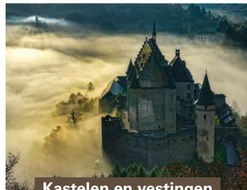
Kastelen en vestingen

Wandelen is de beste manier om de Luxemburgse landschappen te ontdekken. Even charmant als fascinerend, variëren ze van laagland tot bossen, met hier en daar enkele meren en rivieren, een schilderachtig dorp, een ruïne die aan het verleden doet denken of een uitzonderlijk panorama waarop u niet uitgekeken raakt. De vele wandelroutes, die over het hele land verspreid liggen, laten u kennismaken met de vijf regio's van het Groothertogdom Luxemburg: de hoofdstad en haar omgeving, de Ardennen, het Land van de Rode Aarde in het zuiden, het Regio Mullerthal en de Moezel Regio.